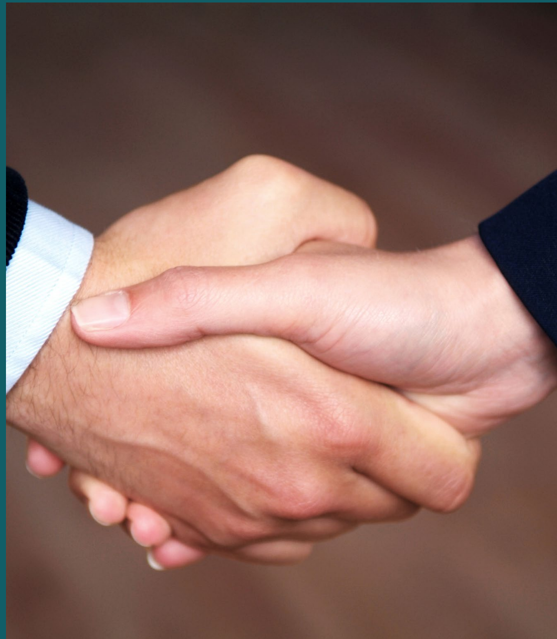
Regeringen och SKR har slutit en ny överenskommelse för psykisk hälsa