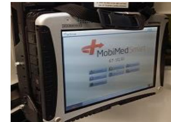
MobiMed ordinarie Ambulanssystem