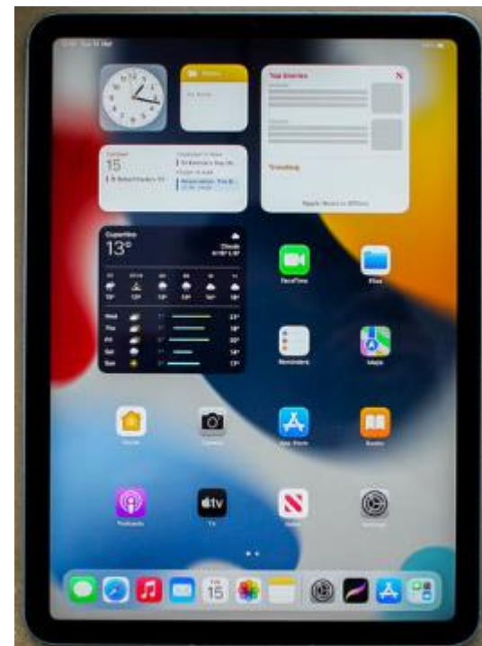
NOVA Ward på IPAD