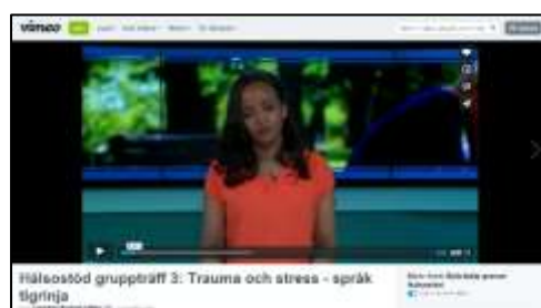
Figur 1: Filmer till Hälsostöd

En viktig del i insatsen är att materialet ska vara tillgängligt även för personer med begränsad läs- och skrivkunighet. Förslag finns på hur skriftliga övningar kan ersättas med muntliga varianter.