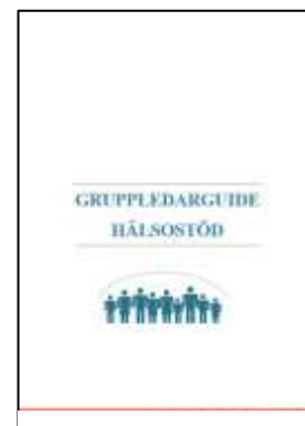
Figur 3: Guide till handledare för hälsostöd

Handledningen är utformad som ett praktiskt stöd att användas i samband med att träffarna genomförs.