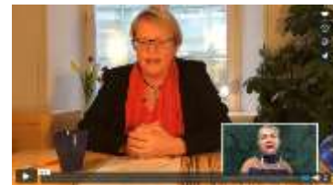
Figur 2: Filmer om hälsoundersökningar och svensk hälso- och sjukvård

En serie av korta filmer har tagits fram på flera språk som informerar om hälsoundersökningar och grundläggande information om svensk hälso- och sjukvård, exempelvis hur man söker vård.