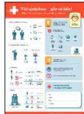
Figur 1: Affisch med hälsoinformation

Affischen bygger primärt på ett symbolbaserat språk för att öka möjligheten att informationen når fler grupper inklusive de med läs- och skrivsvårigheter.