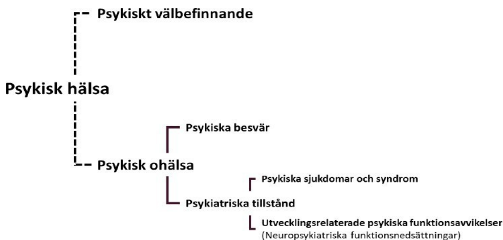
Bild 1: Modell som beskriver hur begrepp inom området psykisk hälsa förhåller sig till varandra. 5

Sambanden mellan psykisk ohälsa och självmord är tydliga och psykiatriska tillstånd innebär en ökad risk för suicid. Trots detta har långt ifrån alla som försöker ta sitt liv eller som dör i suicid haft kontakt med vården.