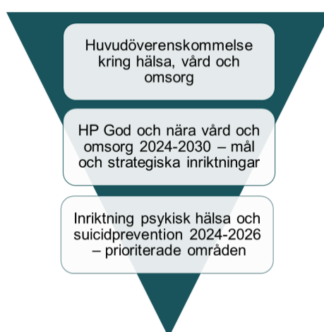
Bild 2. Kopplingen mellan Handlingsplan god och nära vård och omsorg (HÖK) och Inriktning för psykisk hälsa och suicidprevention.

Det länsgemensamma arbetet för psykisk hälsa och suicidprevention är en del i arbetet för god och nära vård och omsorg. Huvudöverenskommelsens övergripande målområden och Handlingsplan för god och nära vård och omsorg 2024 – 2030 är genom sina strategiska inriktningar styrande i detta arbete.