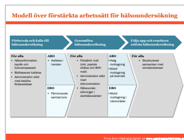
Figur 2: Modell över förstärkta arbetssätt

Modell över förstärkta arbetssätt som inkluderar struktur för hälsoundersökningar att använda vid genomlysning av befintlig process, samt förslag på förstärkta arbetssätt för respektive målgrupp.