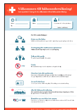
Figur 3: Bildbaserad kallelse

Kallelsen finns översatt till flera språk.